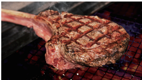
炭火で焼いたお料理が自慢です

ゆっくりとした時間が流れる落ち着いた雰囲気 の鎌倉御成町。地域の一番を目指し、「1 (uno)」と名付けました。鎌倉駅すぐに新しいアマルフィイの誕生です。